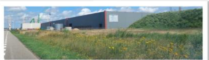
▲ Bulk Terminal Zeeland in de Quarreshaven in Vlissingen-Oost

Ondanks de juridische complexiteit die besloten ligt in het werken met partners zijn er goede ervaringen opgedaan. Gemeenten worden – indien mogelijk - in staat gesteld bestuursrechtelijke maatregelen te nemen op basis van een rapportage die wordt opgesteld na een strafrechtelijke interventie. In een aantal zaken is de strafrechtelijke aanpak afgestemd met de RIEC-samenwerkingspartners, zodat interventies in een integrale casus synchroon kunnen lopen. Dit komt weer ten goede van het gewenste 1-overheidsoptreden.