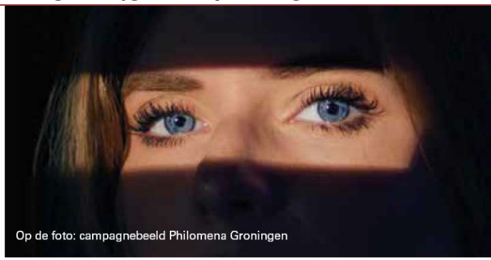
Op de foto: campagnebeeld Philomena Groningen

24 Groningen krijgt steunpunt tegen intieme terreur en femicide